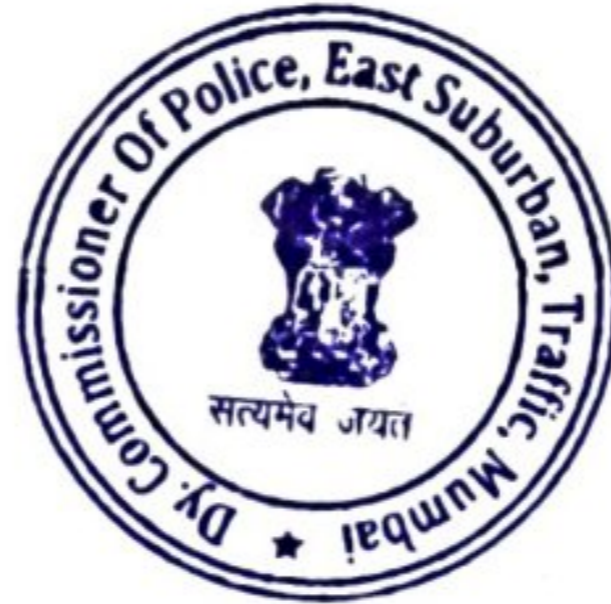
(Pradeep Chavan) Deputy Commissioner of Police, Eastern Suburb Traffic, Mumbai