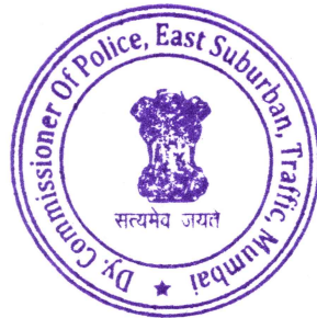
(Pradeep Chavan) Deputy Commissioner of Police, Eastern Suburb Traffic, Mumbai